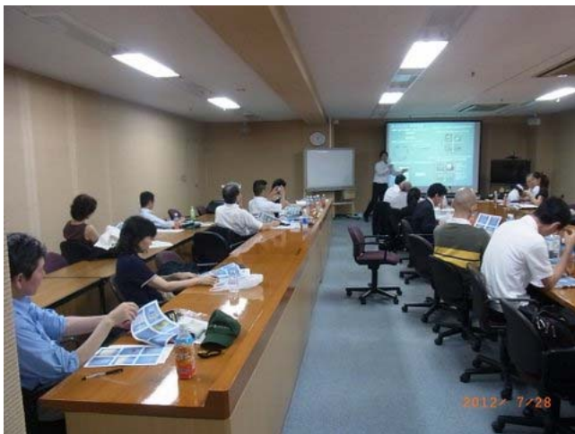
会員の聴講の様子