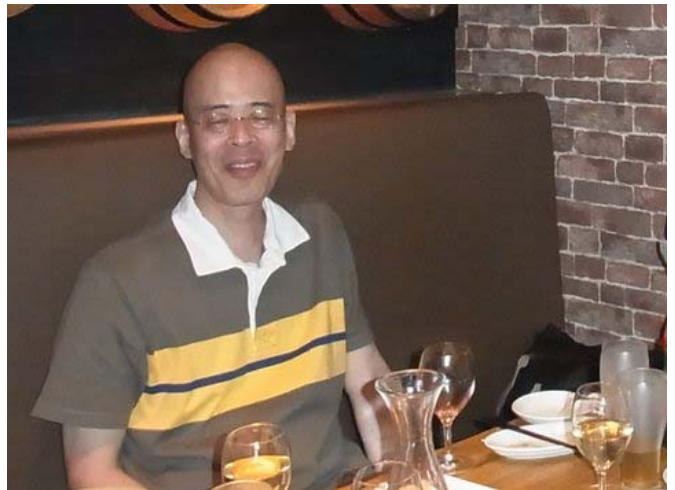
イタリアンのお店でサンタルチアを大声で熱唱 すごく上手でうっとりとはらはらとの人も(^.^)聞きました