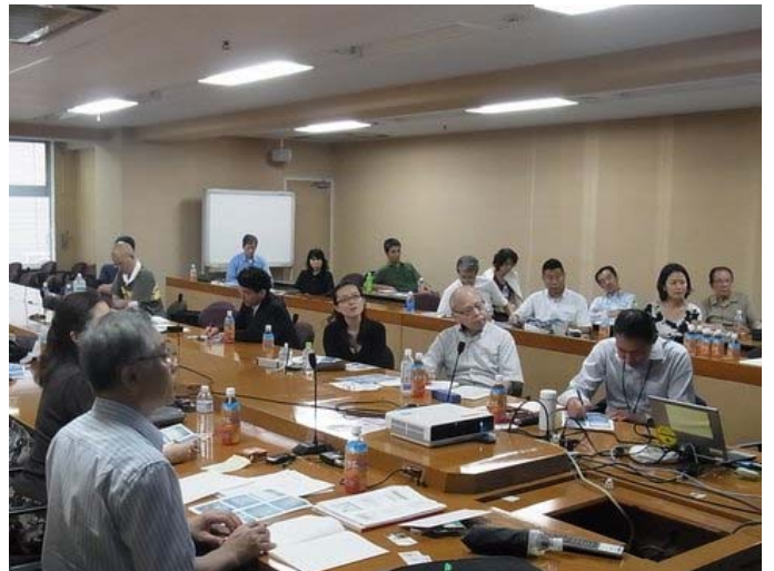
熱心に聴く会員の様子