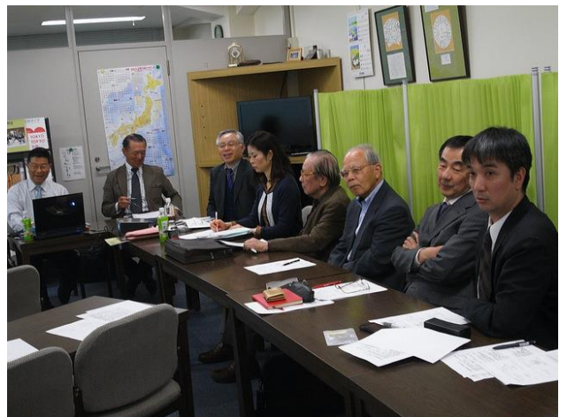
その後質疑応答タイム、約30分間ほとんど全員から質問や感想が述べられ非常に盛り上がりました。