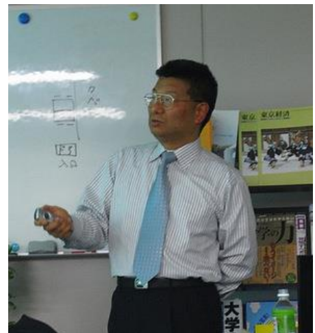
(小沢先生の講演ぶり)