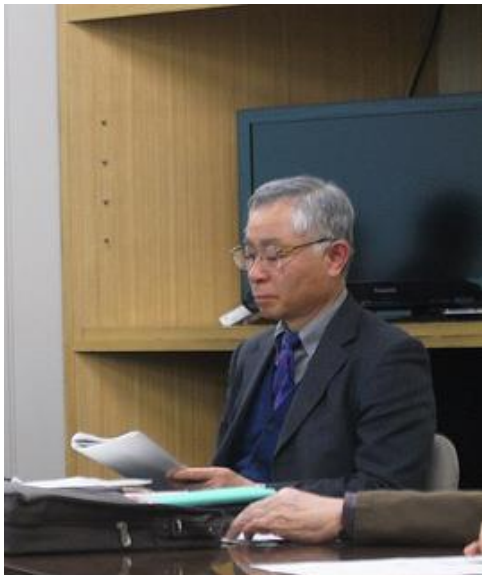
司会の植木先生の挨拶と講師紹介