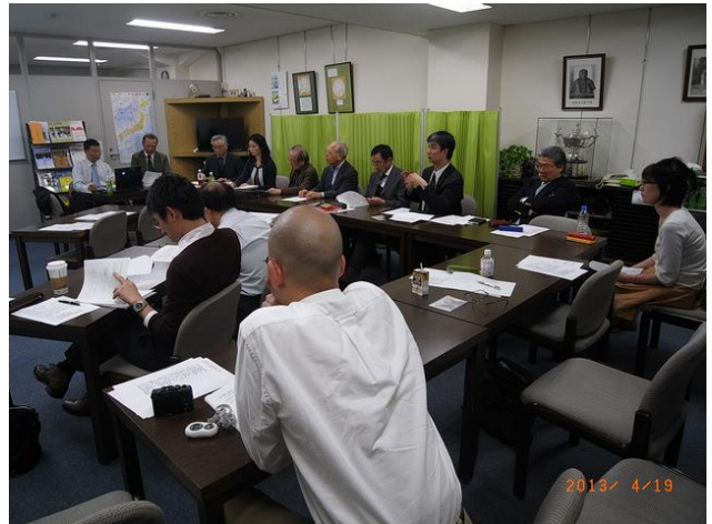
(聴講者の様子) (今回も狭いところに大勢参加、で全景が撮れませんが…すみません)