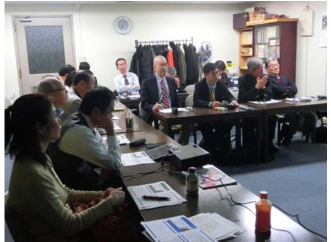
発表を聞く参加者