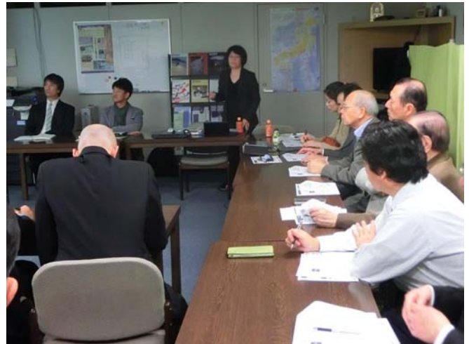
廣瀬さんの発表を聞く参加者