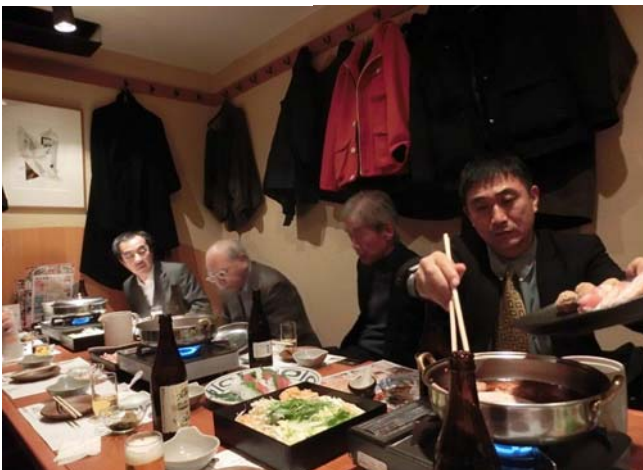
終了後、大手町素材屋で鍋を囲む懇親会