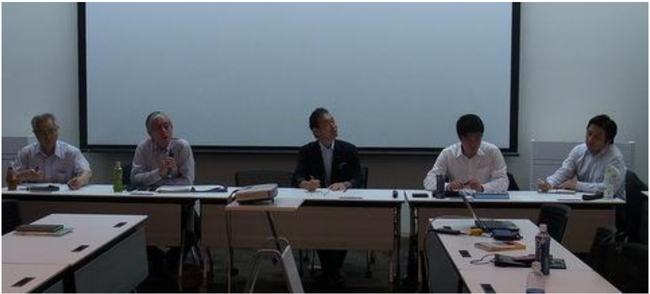
(↑ 司会の植木部会長)