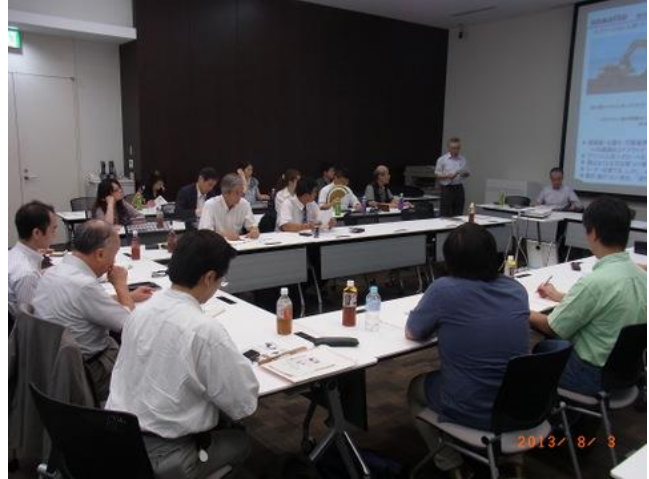
(開始時の全体の様子、参加者 30 名)