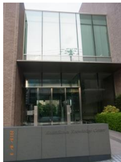
(エーザイ小石川ナレッジセンター)