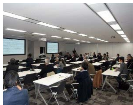
(発表時の大会会場の遠景)